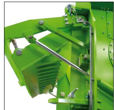
Eenvoudig te onderhouden